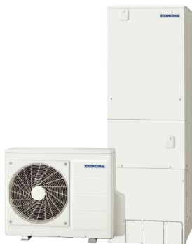
エコキュート 最新モデル 「CHP-HXE37AY5」