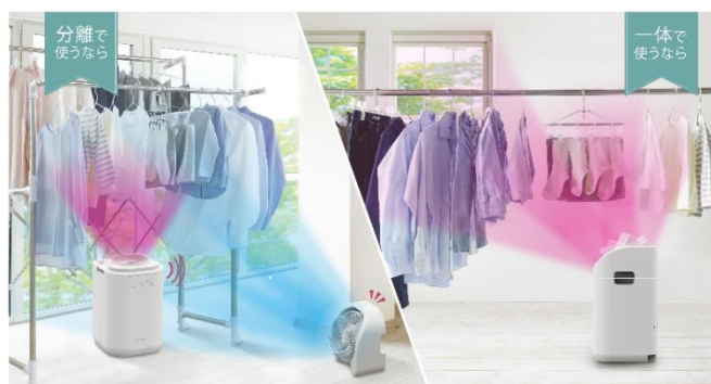
サーキュレーター分離時は付属の電源コードが必要となります。写真はイメージで

本製品は、業界初 ※1 の除湿機本体とサーキュレーターを分離できる衣類乾燥除湿機で、分離/一体/単独運転ができるため、ライフステージに伴って変化する洗濯物の量や干し方に対応することが可能です。