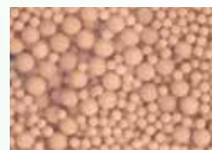
セラミックボール

高硬度水対応キット(エミール)は、内部のセラミックボールが水流で攪拌され、水を帯電させます。この作用によりスケールを柔らかくして、配管への付着を抑制します。