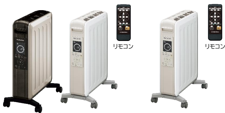
DHS-1521 シャンパンブラウン(TC)/ホワイトベージュ(CW)

当社は、暮らしに安心やゆとりを提供し、「快適で心はずむ毎日」の実現を目指すとともに、エネルギーの効率的な利用などを通じて、持続可能な社会の実現に貢献してまいります。