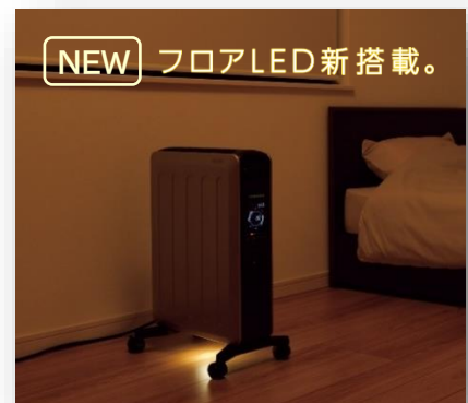
DHS-1221 ホワイトベージュ(CW)