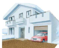
■パイプ敷設イメージ

路面の雪を温水で暖めて雪を溶かすので、散水消雪と違い歩行者に水がかかったり、凍結することがありません。凍結しやすい橋の上や階段・ベランダなどコンクリート内にヒーティング管を敷設し、より生活しやすい環境を作りだします。駐車場や歩道、エントランス、屋外階段にオススメです。