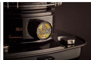
JR東日本商品化許諾済