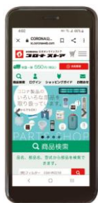
公式オンラインストア

エコキュートの操作以外にもお役立ち情報サイトやWEB修理受付など便利な機能を搭載しております。