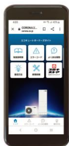
オーナーズサイト