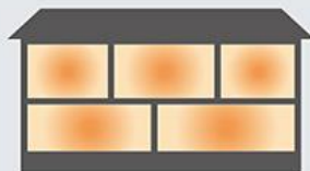
居住空間の 全室の温水式暖房