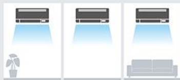
リビングなど 2～3部屋の同時冷房